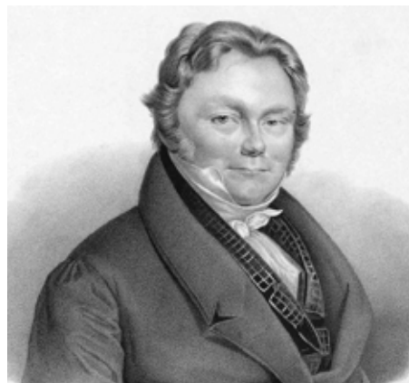
Йёнс Якоб Берцелиус (1779–1848)

Приверженцем данного учения был и один из основателей органической химии шведский учёный Я. Берцелиус. В своём учебнике химии Я. Берцелиус (1827) высказывает убеждение, что "... в живой природе элементы повинуются иным законам, чем в безжизненной". Однако, отмечая удивительное совершенство живой природы и загадочность тех причин, которые обусловили это совершенство, Я. Берцелиус постоянно искал способы выяснения этих причин отнюдь не в сверхъестественных силах.