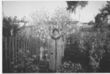
Вере Григорьевне, моей маме, посвящается