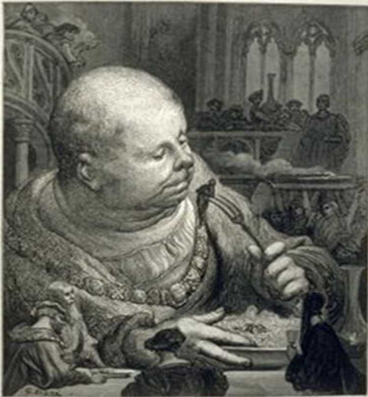
Трапеза Гаргантюа. Иллюстрация Гюстава Доре.