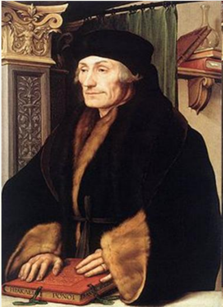
Эразм Роттердамский (1469 - 1536)

С. Цвейг, писатель, биограф гуманиста, назвал гуманиста «славой и светочем своего времени».