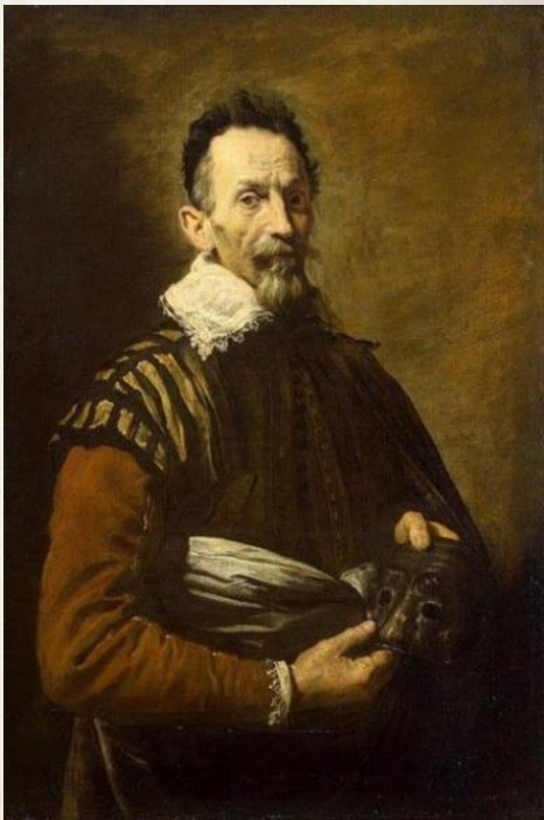
Мигель де Сервантес Сааведра (1547 - 1616)

известен как автор одного из величайших произведений мировой литературы — романа «Дон Кихот».