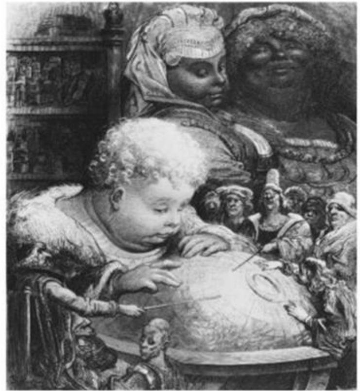
Юный Гаргантюа изучает глобус. Иллюстрация Гюстава Доре.