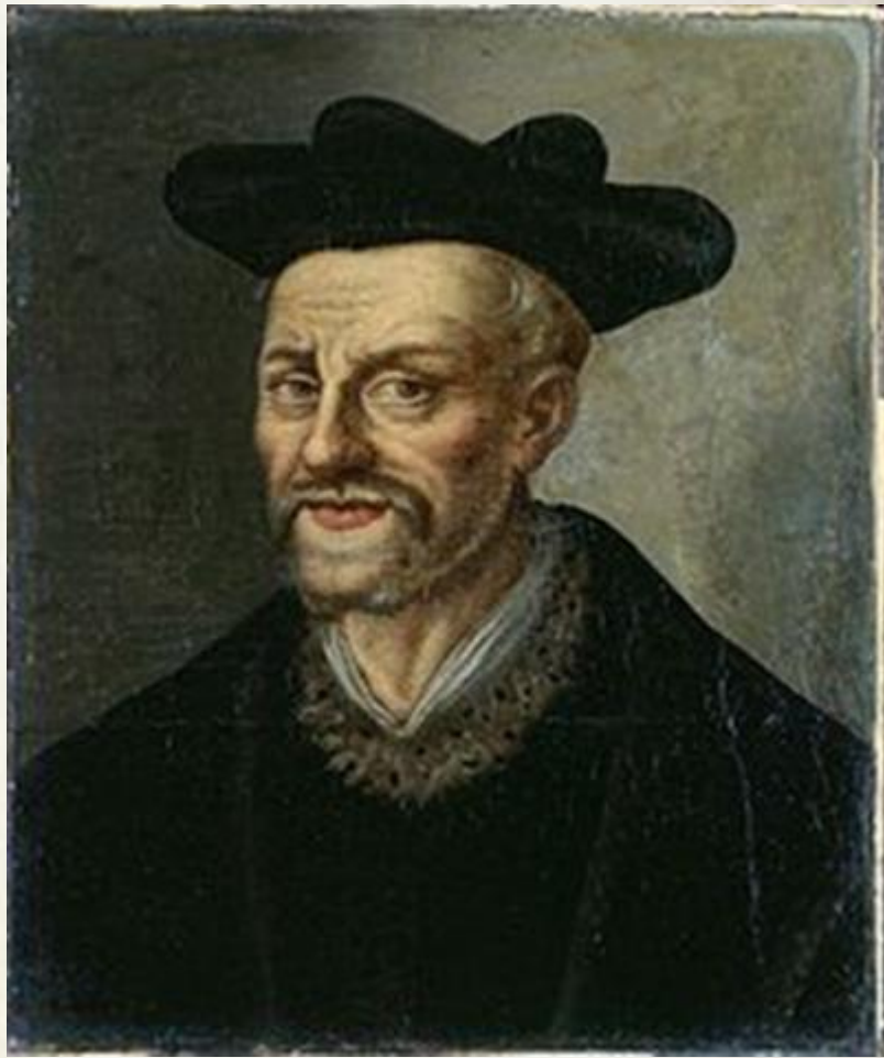
Франсуа Рабле (1494-1553)

Французский писатель, один из величайших европейских сатириков-гуманистов эпохи Ренессанса, автор романа «Гаргантюа и Пантагрюэль»